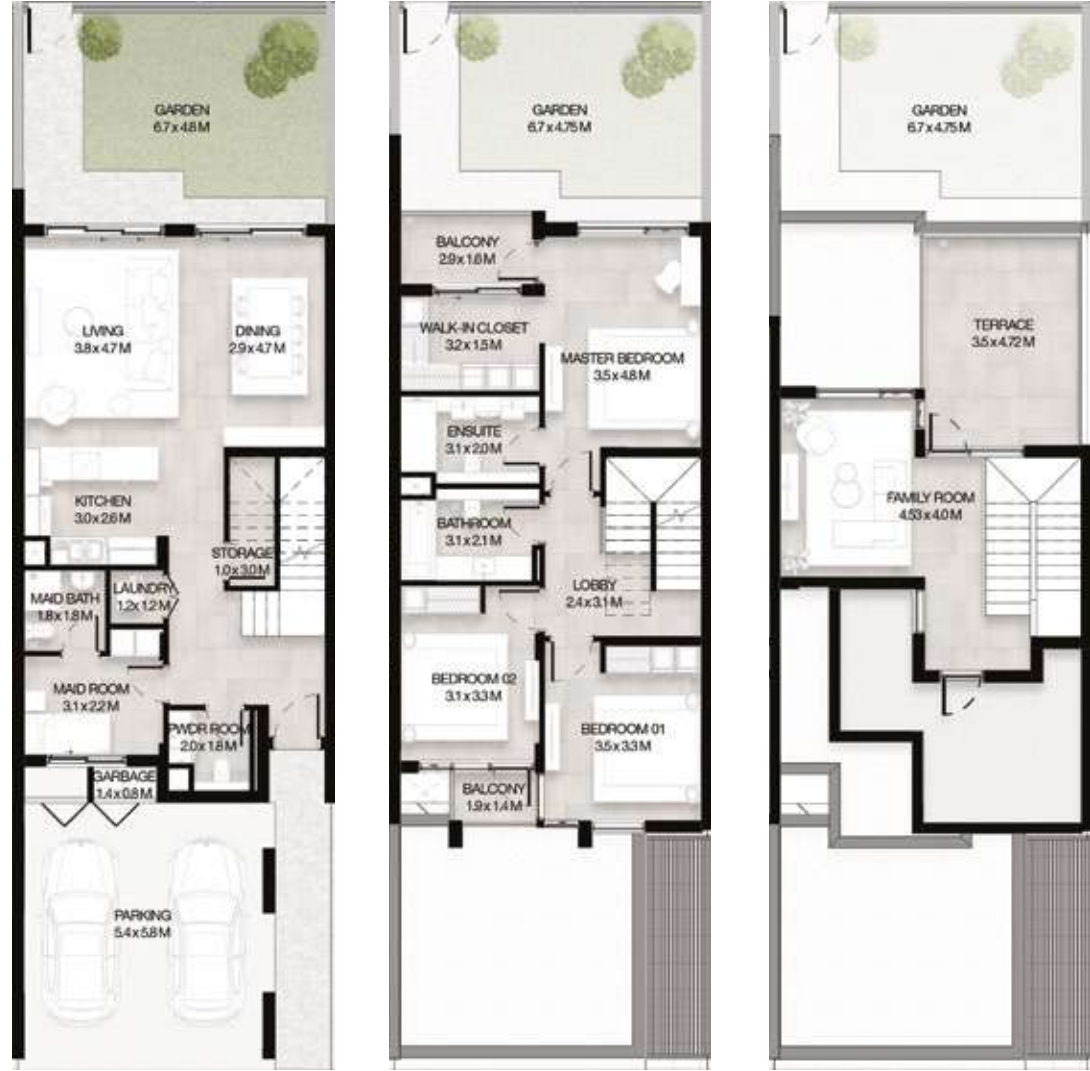
GROUND LEVEL الطابق الأرضي FIRST LEVEL الطابق الأول ROOF LEVEL السطح

3 غرف نوم + غرفة عائلية و غرفة خادمة - الوحدة المتوسطة