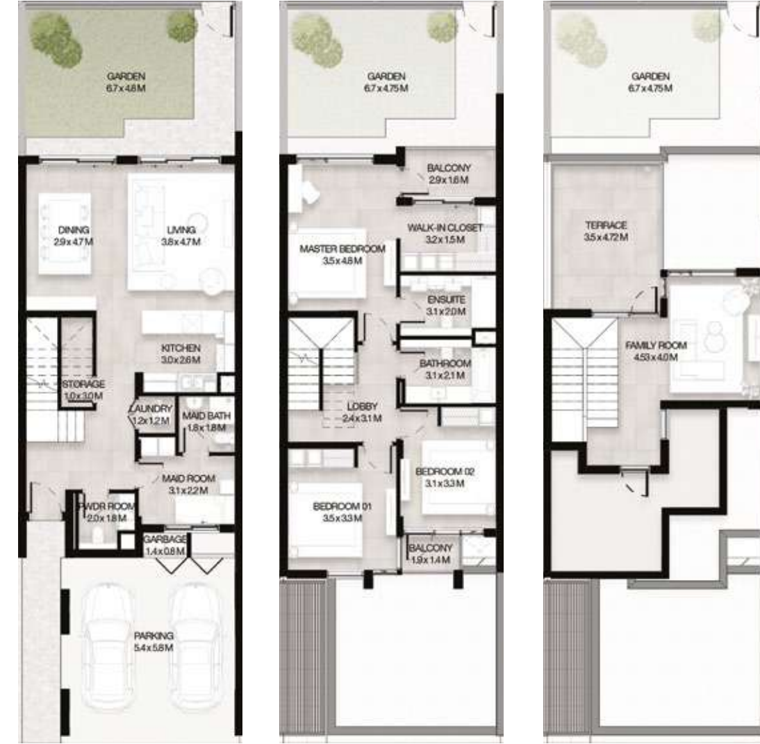
GROUND LEVEL الطابق الأرضي FIRST LEVEL الطابق الأول ROOF LEVEL السطح

3 غرف نوم + غرفة عائلية و غرفة خادمة - الوحدة المتوسطة (معكوسة)