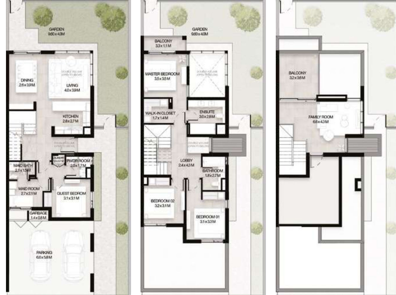
GROUND LEVEL الطابق الأرضي FIRST LEVEL الطابق الأول ROOF LEVEL السطح

4 غرف نوم + غرفة عائلية و غرفة خادمة - الوحدة النهائية (معكوسة)