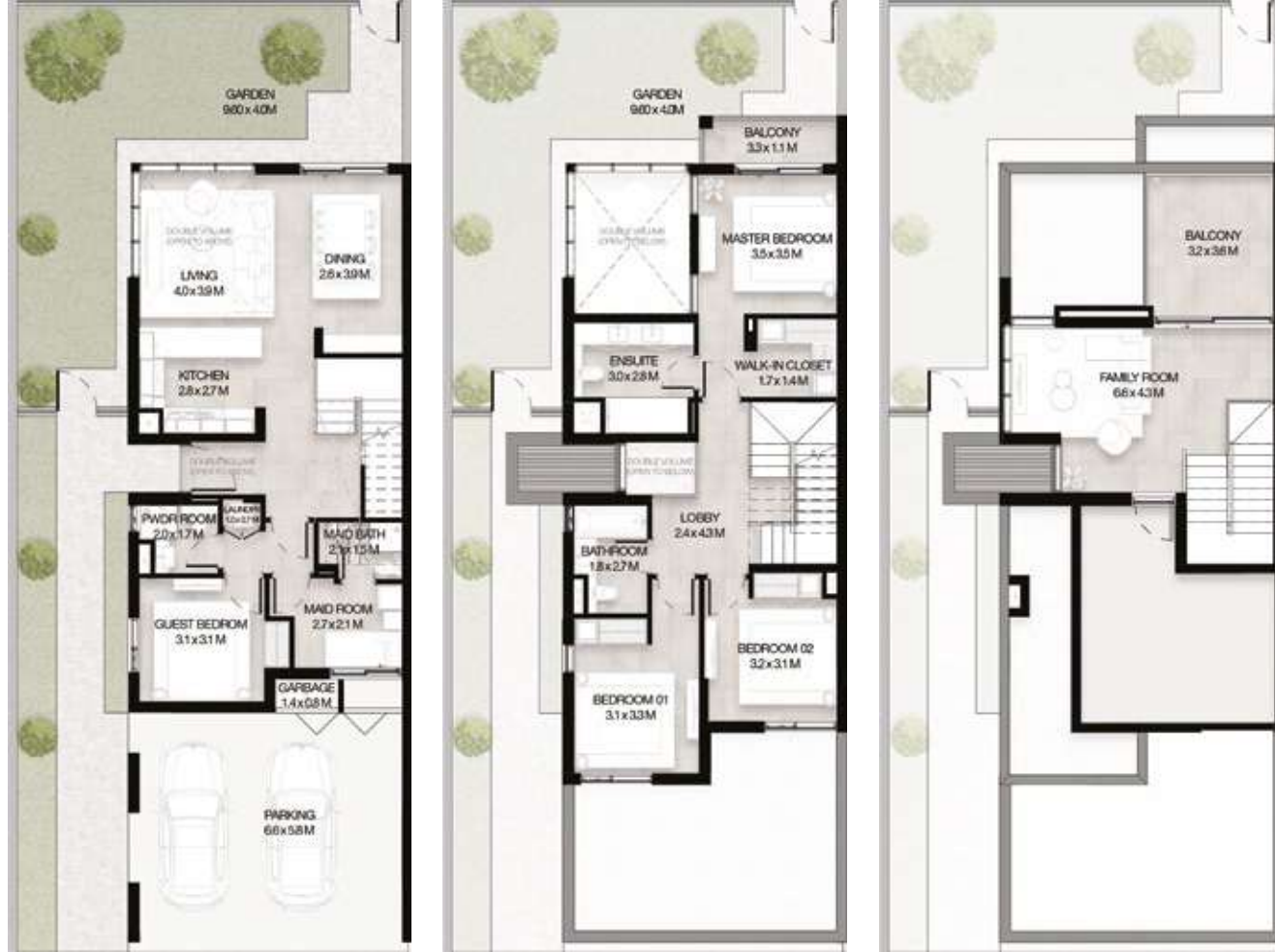
GROUND LEVEL الطابق الأرضي FIRST LEVEL الطابق الأول ROOF LEVEL السطح

4 غرف نوم + غرفة عائلية و غرفة خادمة - الوحدة النهائية